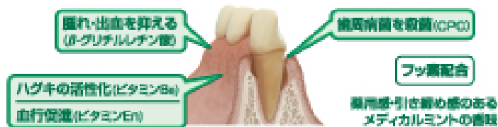
図 2：ハグキを活性化し、歯周病による腫れ・出血の発生を原因から防ぎます。