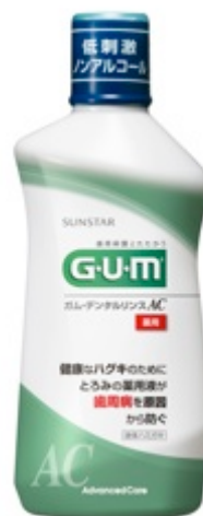
ガム・デンタルリンス AC