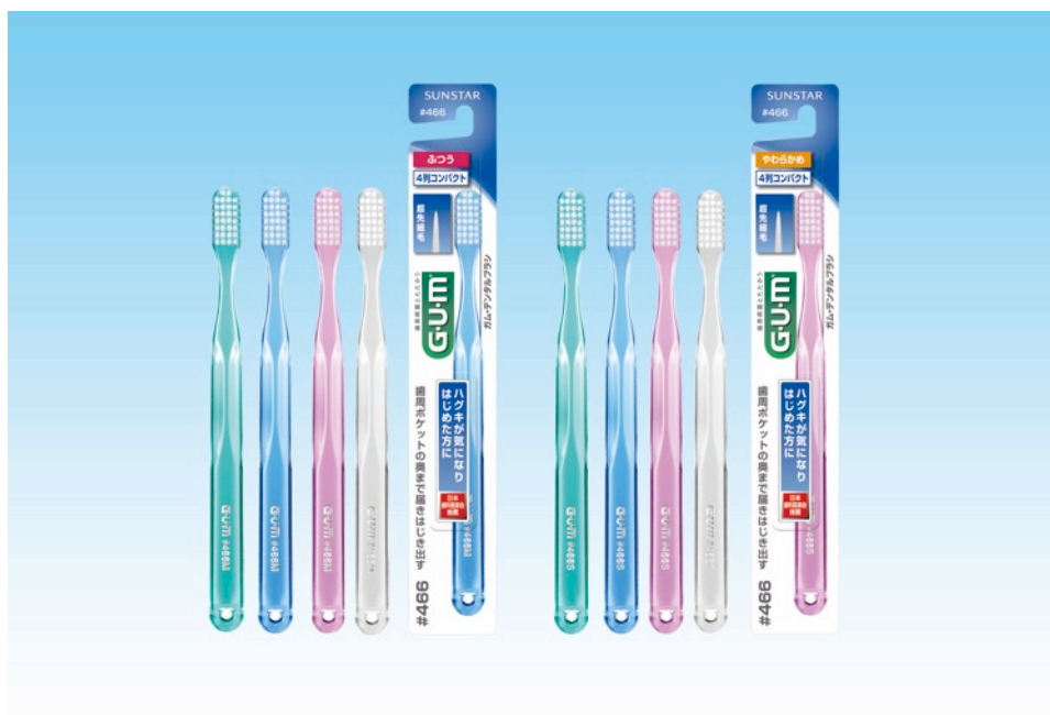
ガム・デンタルブラシ #466 ふつう・#466 やわらかめ