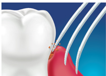
図 1：超先細加工を施した毛先が、狭い歯周ポケットや歯と歯の間に入り込み、高い反発力で歯周プラークをはじき出します。