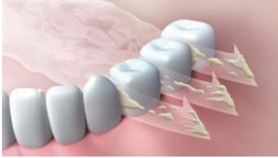
図1 歯垢のもとなどの汚れをやわらかくし、浮かせて洗い流します。