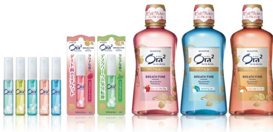
オーラツー ブレスファイン マウススプレー（左） オーラツー ブレスファイン マウスウォッシュ（右）

「息のメイク直し」アイテムとしてより女性が手に取りやすい新パッケージで、2015年3月9日（月）より全国で発売いたします。