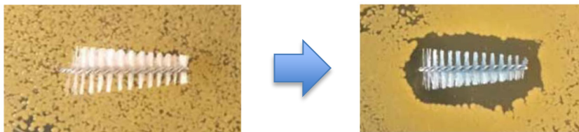
従来フィラメント