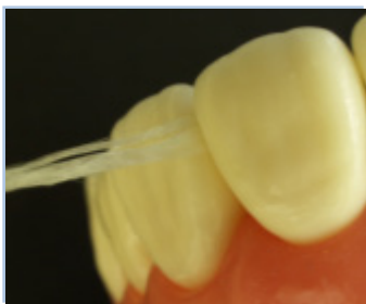
図1：フラットタイプは断面が平らで歯間に挿入しやすい。