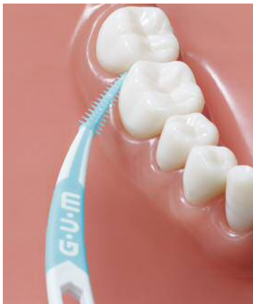
図3：奥歯の歯間部にも届きやすいカーブ型