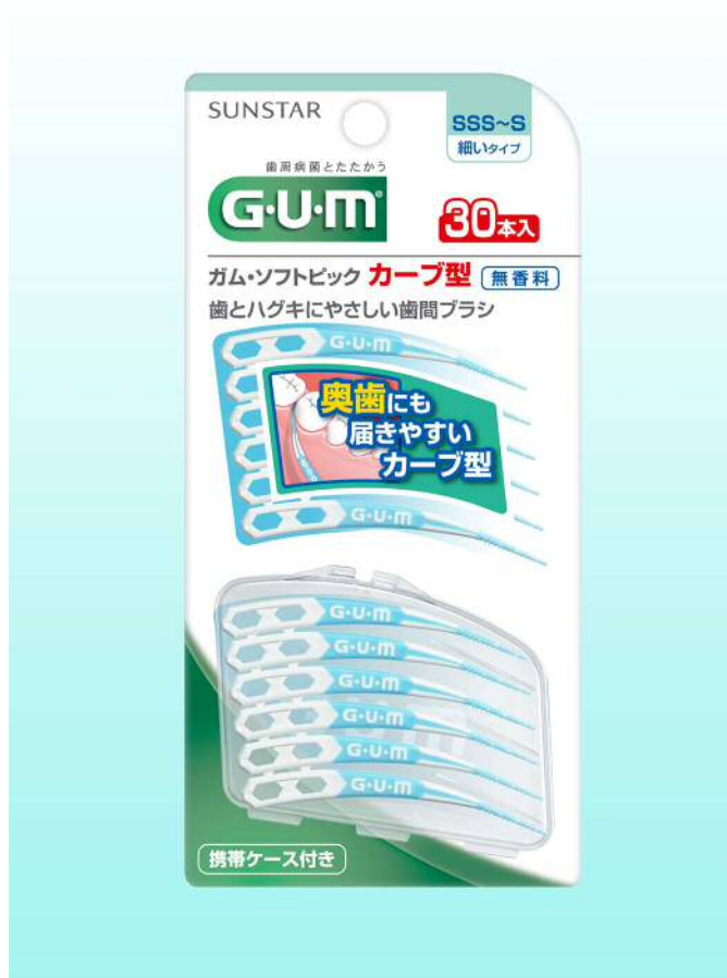
ガム・ソフトピックカーブ型 30P

カーブ型なので奥歯に届きやすく、歯周病の原因菌のすみかである歯周プラーク（歯垢）をやさしくかき出します。また、滑りにくいラバーハンドルなので持ちやすく、歯間清掃するのが初めての方にもオススメです。