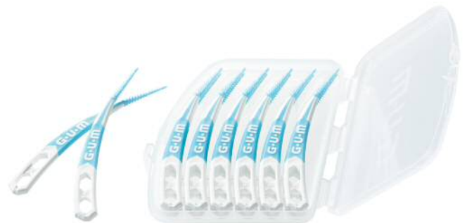
図4：持ち運びに便利な携帯ケース付き