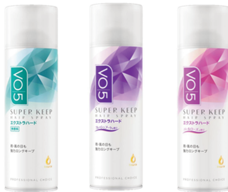
VO5スーパーキープヘアスプレー<エクストラハード> 無香料 (左)・フレッシュブーケの香り (中央)・パールローズの香り (右)