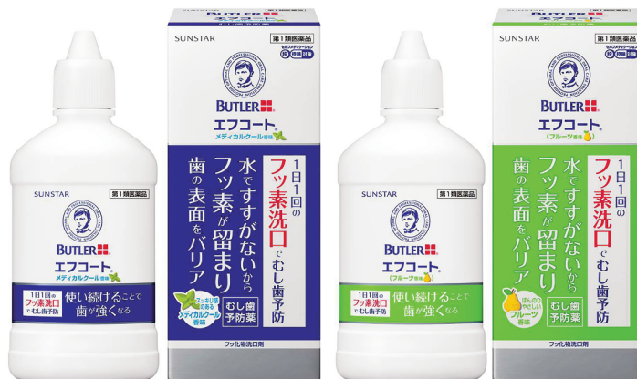
（左）エフコート メディカルクール香味／（右）エフコート（フルーツ香味）