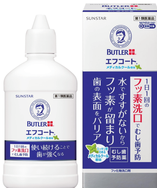
エフコート メディカルクール香味

*3 要指導医薬品が第1類医薬品へ変更になるとインターネットでの購入が可能になります