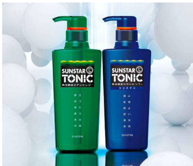
サンスタートニック爽快頭皮ケアシャンプー (左) サンスタートニック爽快頭皮ケアシャンプー リンスイン (右)

近年男性用シャンプー市場が注目されていますが、30代以上の男性の約 4 割がまだシャンプーを家族と兼用しているのが現状です*。男性は思春期から 30 代頃にかけて皮脂分泌量が増加し、同世代女性よりも多く分泌されます。そのため皮脂分泌量が多い男性は、皮脂をしっかり落とす洗浄力の高いシャンプーで頭皮クレンジングをすることが大切です。また男性が頭皮が脂っぽいと感じる年代は 30 代が最も多く*、皮脂でベタついて見える髪は不潔に感じるなど見た目の悪い印象を与える場合もあり、頭髪の悩みの一因にもなっています。サンスタートニックはベタツキやニオイの原因となる皮脂を除去する洗浄力の高いシャンプーで毎日洗髪する新習慣“オトコの頭皮クレンジング”をサポートします。