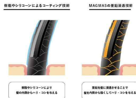
図3)マグマスの毛髪強化イメージ