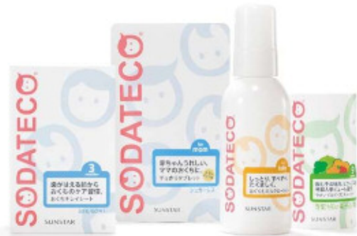
左から: おくちキレイシート、すっきりタブレット(ママ用) はぐくむミルクローション、やさいではぐくむスムージー

SODATECO シリーズサイト: https://www.sodateco.com