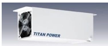
バックヤード設置用「TITAN POWER」