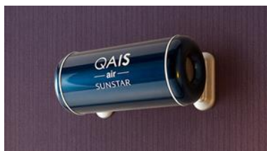
室内設置・業務用「QAIS -air-01」