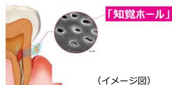
図1 歯の根元にある「知覚ホール」

知覚過敏による歯がしみる症状は、歯周病や加齢等によりハグキが下がり、露出した歯の根元にある「知覚ホール(象牙細管)」を通じて、刺激が神経に伝わって起こります。そのため、歯の根元に冷たい飲み物やハブラシが触れた時に痛みを感じることがあります。