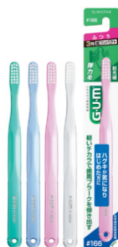
ガム・デンタルブラシ#166