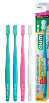
ガム・ウェルプラス デンタルブラシ#226