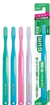
ガム・デンタルブラシ#191